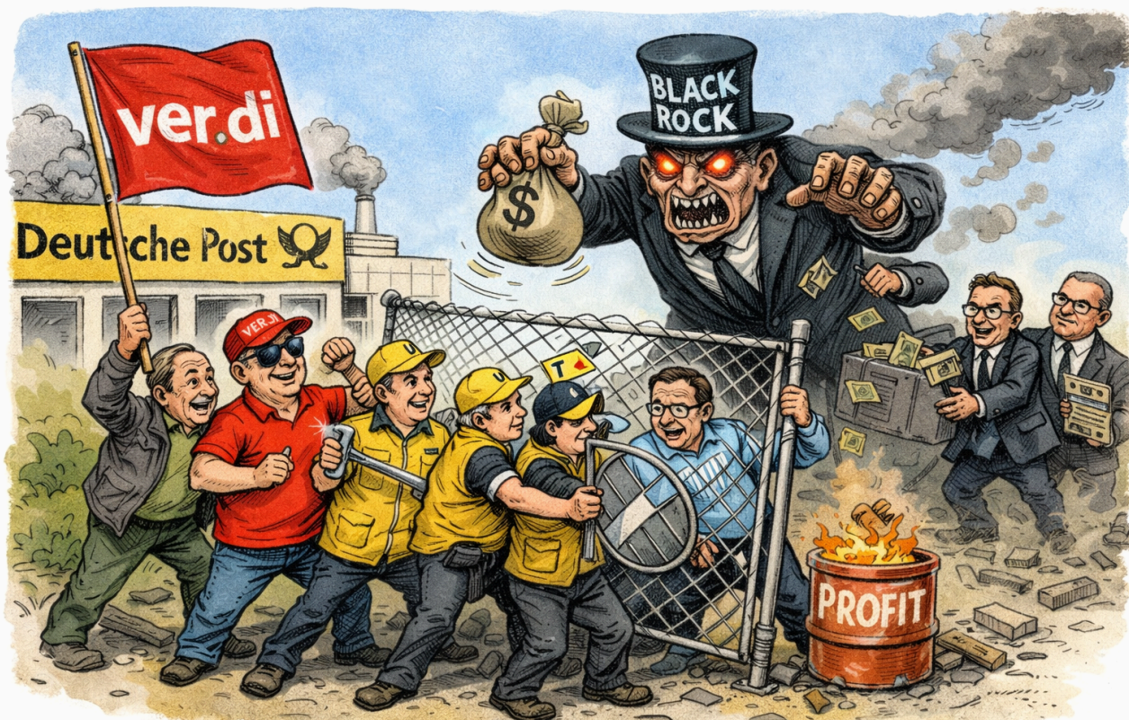
Unsere Kampfperspektive: Die Post gegen die Aktionäre verteidigen

Mit dieser Perspektive stärken wir die Arbeiter im Betrieb indem wir die Einheitsgewerkschaft, die Ver.di stärken.